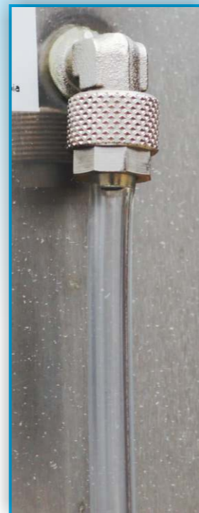
Kontrolni nivostat daje uvid u odnos voda/vazduh