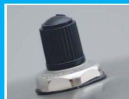
Ventil za regulaciju pritiska