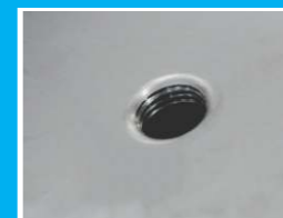
Priključak za manometar