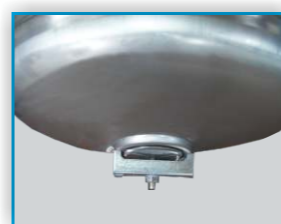
Otvor na dnu posude olakšava proces čišćenja