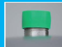
Priključak za sklopku